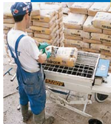
Malaxage de Topcem à l'aide d'un malaxeur horizontal

Produit conforme aux prescriptions de la directive 2003/53/CE