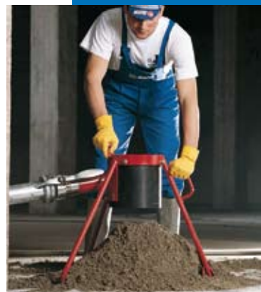
Gâchage de Topcem