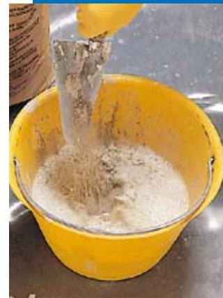
Préparation de la barbotine d'accrochage composée de Topcem et de Planicrete Latex

Topcem n'est pas un liant à prise rapide et il se travaille comme une chape ciment traditionnelle.