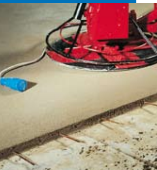
Finition à l'hélicoptère