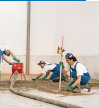
Application de Topcem