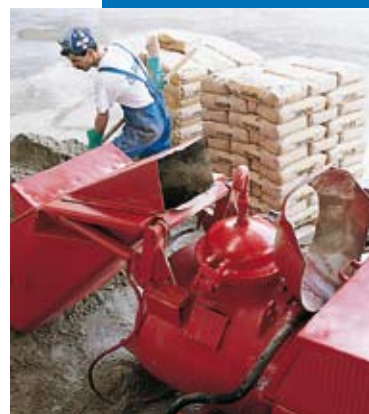
Malaxage et pompage de Topcem avec une installation automatique