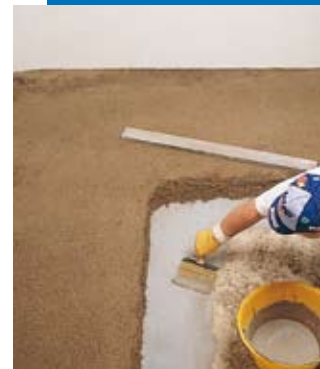
Application de la barbotine d'accrochage pour chape adhérente Topcem