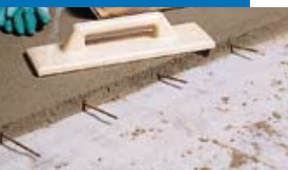
Chape Topcem avec fers de reprise