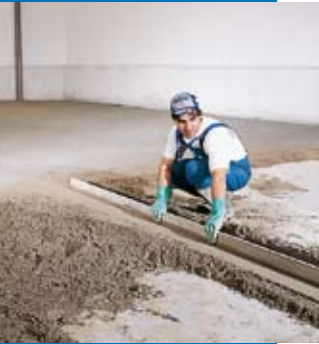
Exécution des nus de réglage